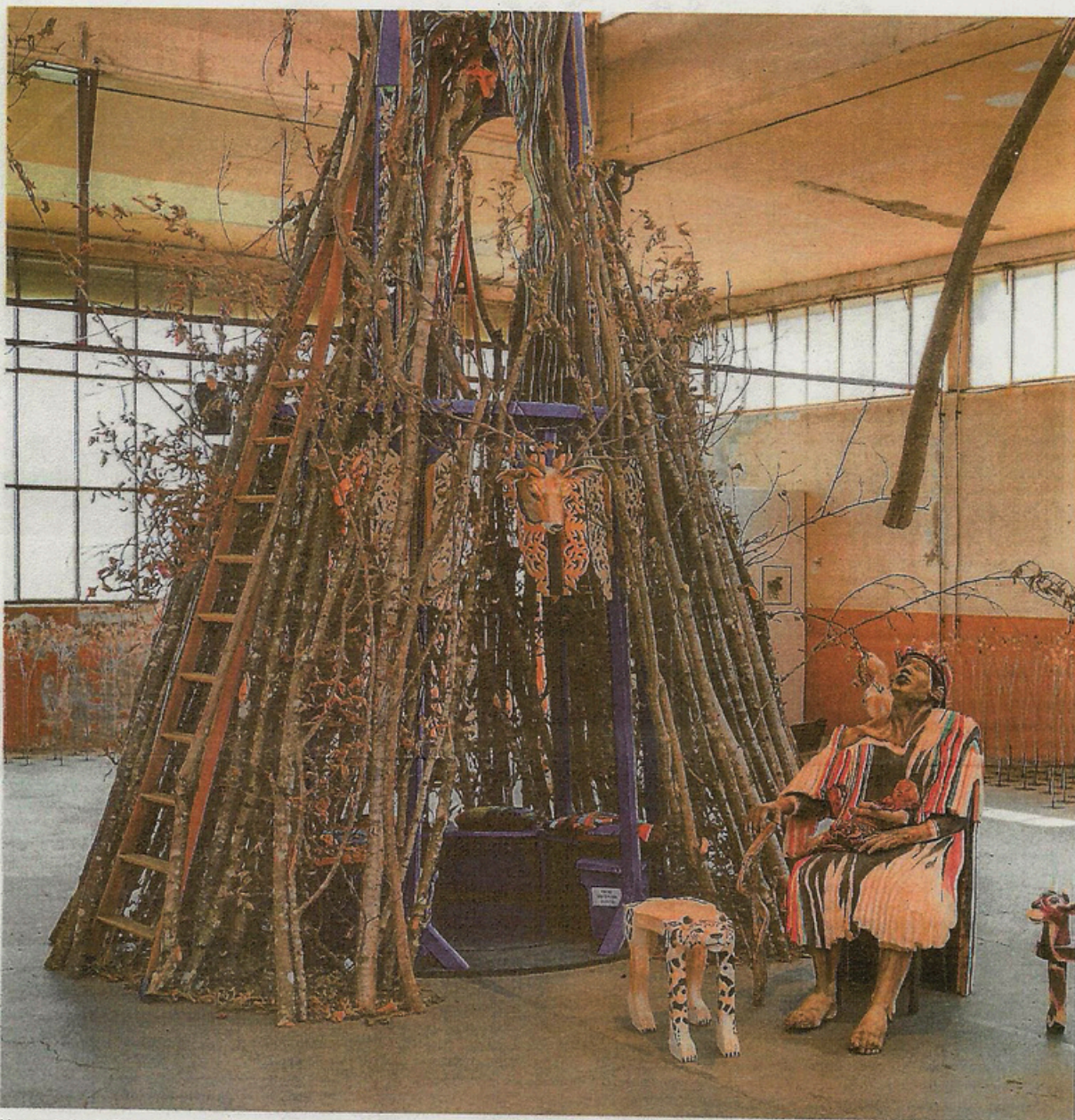
Vue partielle de l'exposition à l'Espace Condor à Courfaivre, avec au premier plan L'Arbre de Vie et L'Homme qui sourit .

Promenons-nous dans les bois... présenté dans l'Espace Condor débute par des messages écrits tutoyant le visiteur. Ils interpellent d'emblée l'enfant, celui que l'on se plaît à redevenir pour écouter, vivre une histoire. L'artiste invite à librement s'impliquer en plusieurs occasions: par le coloriage, l'écriture, les traces et mouvements corporels. On entre ainsi dans son univers à la fois foisonnant et respirant de manière ludique, par son propre élan, guidé à travers un parcours plus sensible qu'intel-