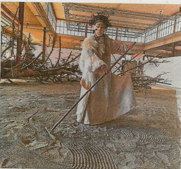
L'Effaceur de traces , performeur ou performeuse qui inlassablement ratisse le sable foulé par le public de l'Espace Condor à Courfaivre.

lectuel. Il est conçu en six escales thématiques qui traversent les âges et peuples du monde avec ses drames, ses paradoxes, ses rêves aussi. Ces étapes mènent, et c'est tout un symbole, à la septième, celle du retour à soi dépouillé de la civilisation. À travers son installation à multiples ramifications, mais sobre, faite de tout ce dont l'art visuel dispose (sculpture, peinture, dessin, écriture, couture, photographie, ready-made, performance, vidéo, lumière, son...), Christine Aymon propose une forme de chemin initiatique. Elle partage aussi son propre idéal de paix et d'harmonie au naturel, tous règnes confondus, sous la protection majestueuse de la forêt, cocon originel en péril.